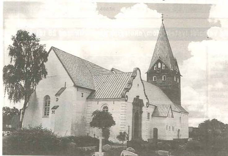
Møgeltønder Kirke har i fortiden udover at være sognekirke også fungeret som slotskirke under Schackenborg. I dag er kirken i selveje og en ganske almindelig sognekirke.

I kirken findes landets ældste endnu fungerende kirkeorgel fra året 1679.