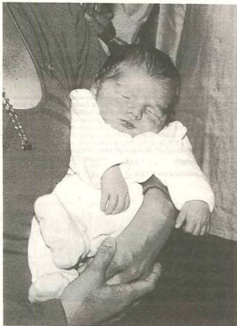
Lilleprinsens dåb finder sted på hjemegnen i Møgeltønder Kirke d. 4. oktober 2002. Storebror blev døbt i Fredensborg Slotskirke d. 6. november 1999, ved navn Nikolai William Alexander Frederik.

Prins Joachim og prinsesse Alexandra afholder dåb for deres søn fredag d. 4. oktober 2002. Barnedåben finder sted på hjemegnen nær Schackenborg i Sønderjylland i Møgeltønder Kirke.