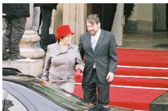
John Donaldson, Marys far, og hans hustru Susan var grebet af den højtidelige stemning under gudstjenesten i Christiansborg Slotskirke.