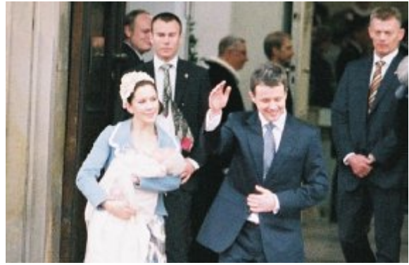
Kronprinsparret kørte efter dåben, bagom Slotskirken, til De Kongelige Repræsentationslokaler på Christiansborg. I Riddersalen fandt den officielle reception sted.

Festen om aftenen, hjemme i Kancellihuset ved Fredensborg Slot, var et helt privat foretagende. Valget af Christiansborg Slotskirke var efter Mary og Frederiks eget ønske. Efter sigende havde Kronprinsparret også ønsket deres bryllup, 14. maj 2004, afviklet i Slotskirken, men kirken var alt for lille til deres nihundrede bryllupsgæster. Christiansborg Slotskirke har kun plads til godt trehundrede kirkegængere.