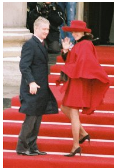
Det belgiske kronprinspar, Mathilde og Philippe nåede frem til barnedåben i Danmark til tiden, trods flyforsinkelser.