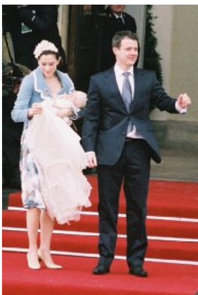
Frederik og Mary var helt klar med lille prinsen klokken 11.00 ved barsedåben lørdag 21. januar 2006.