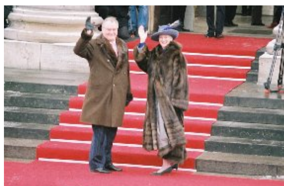
Regentparret ankom til Christiansborg Slotskirke, lige før de nybakte forældre, kronprins Frederik og kronprinsesse Mary.

Kronprinsparret havde fulgt samme tradition som Frederiks bedsteforældre og hans egne forældre havde brugt, ved at anvende fire navne. Denne gang var dog anvendt den lille tronarvings begge bedsteforældres navne, Henri efter Frederiks far og John efter Marys far.