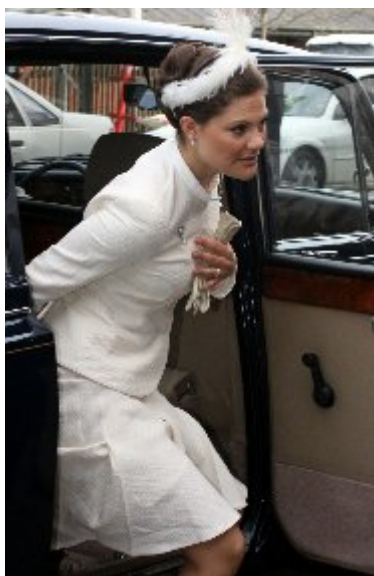
Den svenske tronarving, kronprinsesse Victoria, ankom også til den Svenske Kirke.

Torsdagens program ved det svenske kongepar og den svenske kronprinsesses andendags besøg i Danmark gjaldt så kareturen fra Amalienborg til Københavns Rådhus, hvor overborgmester Ritt Bjerregaard tog imod og bød på de traditionelle rådhuspandekager. Mange tusinde fremmødte, var mødt op i hovedstadens gader for at få et glimt af de kongelige gæster i Danmark. Inden kareturen, klokken 11.00, fandt sted, besøgte kongeparret og kronprinsesse Victoria først den Svenske Kirke, Gustafskirken på Østerbro, derefter sammen med regentparret og kronprins Frederik udstillingen "Dronning Ingrid" i Chr. VIII's Palæ på Amalienborgmuseet.