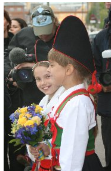
To blomsterpiger stod klar med blomster til dronning Silvia og kronprinsesse Victoria, foran den Svenske kirke.