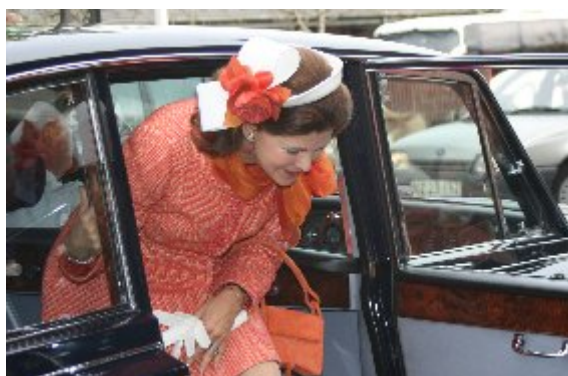
Torsdag morgen, klokken 9.00, ankom dronning Silvia og kong Carl XVI Gustaf til den Svenske Kirke, Gustafskirken i København. Herfra Amalienborgmuseet.

Hele eftermiddagen var sat af til besøg i Ørestaden, bl.a. på det nye IT-universitet, hvor Øresundstinget blev åbnet under temaet. "To lande - et arbejdsmarked - hvad skal der til?". Sidst på eftermiddagen fik Skandinaviens største shoppingcenter, Fields, på Amager, royalt besøg.