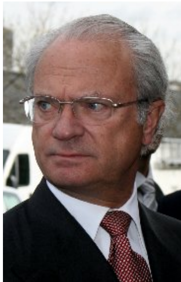
Kong Carl XVI Gustaf, født den 30. april 1946. Viet med Silvia 19. juni 1976. Konge af Sverige 15. september 1973.