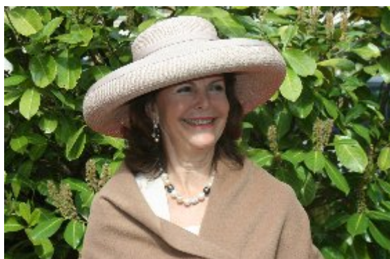
Dronning Silvia, født i Heidelberg 1943. Kongeparret har tre børn: tronfølger, kronprinsesse Victoria, prins Carl Philip og prinsesse Madeleine.

De to tronfølgere, kronprinsesse Victoria og kronprins Frederik var sammen med kong Carl Gustaf til stede ved seminar om "Fremme af dansk-svensk samarbejde inden for ny energiteknologi" hos Dansk Industri. Ved tretten tiden deltog kongen og de to tronfølgere ved et frokostarrangement på Mikkjelgaard i Rungsted. Værten var fødevareminister Hans Christian Schmidt. Som afslutning på statsbesøget, afholdte det svenske kongepar, fredag aften, returnmiddag på rådhuset i Malmø.