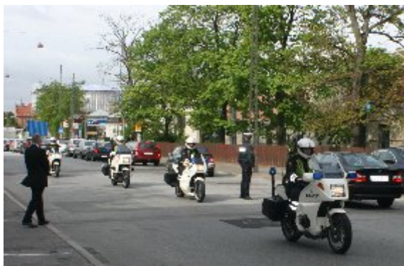
Københavns politi eskorterede de kongelige rundt i byen, holdt trafikken tilbage, så kronbilerne kunne nå frem til gæsternes seværdigheder.

Onsdag startede allerede det tætpakkede program med bl.a. besøg på møbelfabrikken Fritz Hansen, Landbohøjskolen og Danmarks Idrætsforbund. Onsdagen blev rundet af med gallataffel på Christiansborg Slot, hvor der efter en fisketerrin blev serveret en oksemørbrad, dernæst roqueforterte og til sidst en mocca fragilité. Hertil prins Henriks hvid- og rødvin og til sidst champagne. Under middagen spillede Den Kongelige Livgarde både svensk og dansk musik. Sluttede af med C. C. Møllers "Godnat Galop". Danmarks dronning og den svenske konge talte.