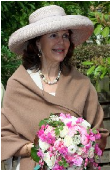
Dronning Silvia, født den 23. december 1943. Viet med kong Carl 19. juni 1976. Forlovelsen fandt sted 12. marts 76.