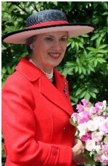
Prinsesse Benedikte, født den 29. april 1944 på Amalienborg i København.

Fredag 11. maj var sidste dag for statsbesøget. Kong Carl Gustaf, kronprinsesse Victoria og kronprins Frederik indledte dagen med virksomhedsbesøg hos Foss A/S i Hillerød, samtidig med at dronning Silvia og dronning Margrethe besøgte Michael Kvium-udstillingen på Ordrupgaard i Charlottenlund. Prinsesse Benedikte ledsagede dronning Silvia på Hukommelsesklinikken på Rigshospitalet, senere på dagen besøgte de Plejehjemmet Lotte på Frederiksberg. Efter rundturen på plejehjemmet var der dansk kaffebord, med wienerbrød, lige efter Silvias hjerte. Dronning Silvia besøgte også Royal Copenhagen i Glostrup.