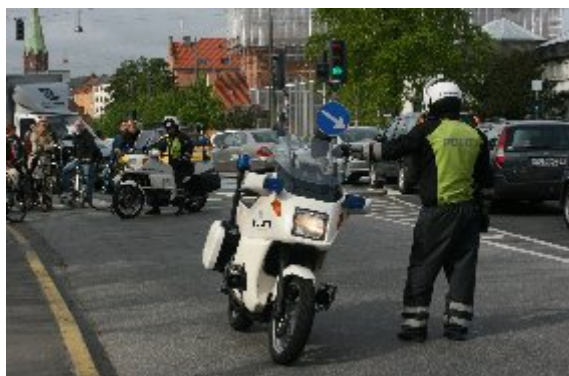
Selv om lyset var grønt, var trafikken alligevel holdt tilbage af politiet, så den kongelige kortege, frit, kunne komme frem til deres seværdigheder.

De to tronfølgere, kronprinsesse Victoria og kronprins Frederik var sammen med kong Carl Gustaf til stede ved seminar om "Fremme af dansk-svensk samarbejde inden for ny energiteknologi" hos Dansk Industri. Ved tretten tiden deltog kongen og de to tronfølgere ved et frokostarrangement på Mikkjelgaard i Rungsted. Værten var fødevareminister Hans Christian Schmidt. Som afslutning på statsbesøget, afholdte det svenske kongepar, fredag aften, returnmiddag på rådhuset i Malmø.