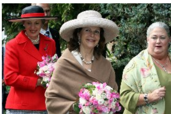
Prinsesse Benedikte ledsagede dronning Silvia, fredag eftermiddag, rundt på Plejehjemmet Lotte på Frederiksberg. Der blev budt på dansk kaffebord.

Torsdag aften overværede kong Carl Gustaf, dronning Silvia, kronprinsesse Victoria, dronning Margrethe, prinsgemal Henrik og kronprins Frederik en festforestilling af balletten "Sacre de Printemps" af Stravinsky i Operaen. Den danske og svenske kongefamilie tog søvejen til Operaen i København. Sejlturen fra Amaliekajen, over til Operahuset, tog kun et par minutter.