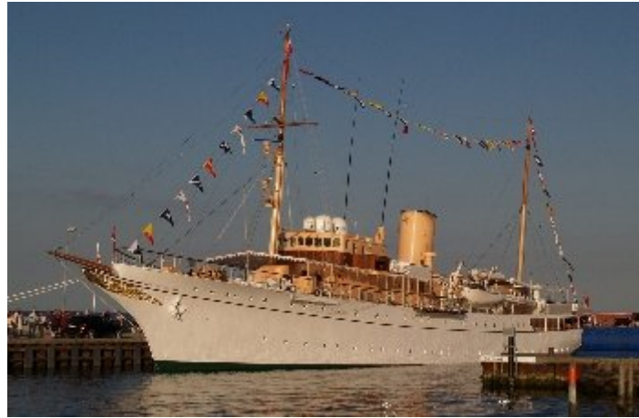
Kongeskibet Dannebrog lagde til kaj i Juelsminde Havn, klokken halv ti, den 6. juni 2008. Kongeskibet havde til aftenen vendt rundt, for at være klar til at sejle ud igen.