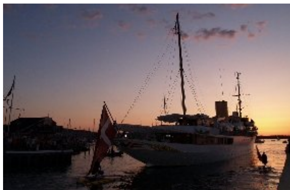
Kongeskibet afsejlede Juelsminde Havn klokken 22.00. Det var regentparrets sidste besøg på denne togt. Tidligere besøgte dronning Margrethe og prins Henrik, mandag 2. juni Esbjerg, tirsdag 3. juni Mandø og torsdag den 5. juni Fredericia.