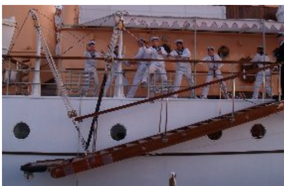
De værnepligtige på Kongeskibet Dannebrog trak landgangen op, gjorde skibet klar til afgang. De værnepligtige er med på kongeskibet i én sæson.

Kongeskibet Dannebrog er en selvstændig kommando, som administreres af dronningens Jagtkaptajn, der er medlem af Majestætens hofstab. Dannebrog's fulde besætning består af 9 officerer, 7 sergenter og 36 værnepligtige, som alle er specielt udvalgt fra marinen. Befalingsmændene er normalt tilkommanderet i to-fire års perioder, mens de menige værnepligtige kun er med én sommer.