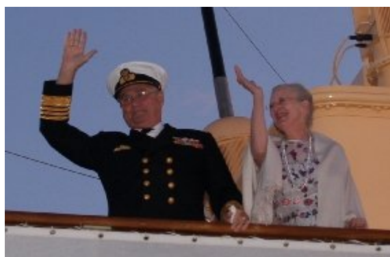
Dronning Margrethe og prinsgemal Henrik kom frem og tog afsked med folket på kajen i Juelsminde. Alle sang for regentparret, da de afsejlede.