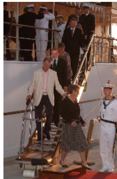
Klokken 21.30 gik gæsterne fra borde, forlod skibet.

Kongeskibet Dannebrog er bygget i 1931 - 1932 på Orlogsværftet i København, som afløser for det forrige kongeskib, hjuldamperen Dannebrog fra 1879. Skibet er navngivet af dronning Alexandrine i 1931. Den kongelige beboelse rummer dronningens og prinsgemalens arbejdsværelser, spisesalon, soverum med mere.