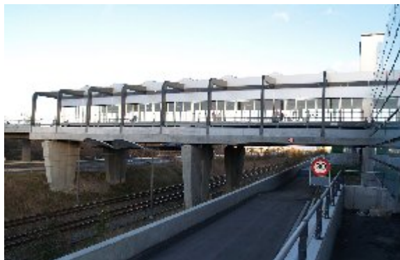
Københavns lufthavn, Kastrup har nu en Metroforbindelse til Københavns City. En rejse fra Nørreport tager 15 minutter.

Af hensyn til miljø og sikkerhed er rygning ikke tilladt i Metroen, hverken i tog eller på de overjordiske samt de underjordiske stationer.