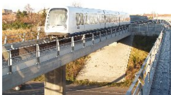
Den nye etape til lufthavnen var tænkt som en bane under jorden, men toget kører mest på terræn over jorden, ved lufthavnen på dæmning.

Mellem Lergravsparken og den nye station ved Terminal 3 i lufthavnen standses på fire nye Metrostationer, Ørestad, Amager Strand, Femøren og Kastrup. Den nye strækning er bygget over jorden og har kostet 1,7 milliarder kroner. Projektet blev færdig en måned før den oprindelige tidsplan, der betød at budgettet var overholdt.