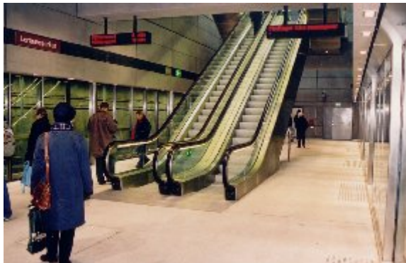
Metro stationen Lergravsparken er sidste station under jorden inden Metro toget kører op på højbane og dæmning, videre til Københavns Lufthavn, Kastrup.