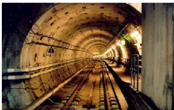
Tunnelen er på det dybeste sted, ved Kongens Nytorv, treogtredve meter under jordoverfladen.

Om godt ti år forventes en Cityring, M3 og M4 til gavn for hovedstadens indbyggere og turister. Cityringen får 17 underjordiske stationer af samme type, som den kendte og flotte Kongens Nytorv.