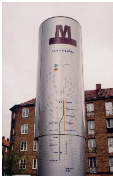
De høje Metrosøjler fortæller de rejsende, hvor man befinder sig i Hovedstaden.

Hans Kongelige Højhed Kronprins Frederik, klippede snoren, den fredag, efterårsdag, i september, klokken 14.30 og forestod indvielsen af strækningen, der betød, at København fik en Metroforbindelse helt ud til lufthavnen. En Metrojæse fra City til Lufthavnen tager blot femten minutter.