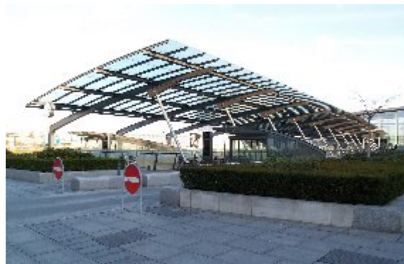
DSB's togforbindelser har også adgang til Terminal 3 i Københavns lufthavn samt Malmø i Sverige, Øresundsforbindelsen.

M1: Vanløse - Flintholm - Lindevang - Fasanvej - Frederiksberg - Forum - Nørreport - Kongens Nytorv - Christianshavn - Islands Brygge - DR Byen - Sundby - Bella Center - Ørestad - Vestamager.