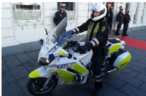
Herning politi eskorterede regentparret op på motorvejen, hvor kongehusets, Krone 121, straks satte kursen mod øst, til Marselisborg i Aarhus.