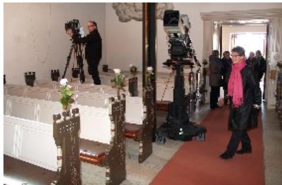
Danmarks Radio, kanal DR K, transmitterede på landsdækkende tv festgudstjenesten direkte.