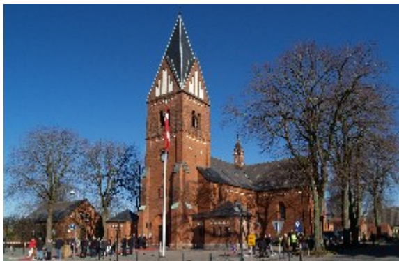
Herning Kirke dannede 1. april 2013 rammen om Hernings 100-års købstadsjubilæum. Afviklede i anledningen en festgudstjeneste.