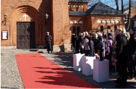
Fremtiden blev repræsenteret ved studerende fra Hernings designuddannelse Via University College TEKO. De studerende havde som et led i deres uddannelse arbejdet med, hvordan præstedragterne kunne se ud.