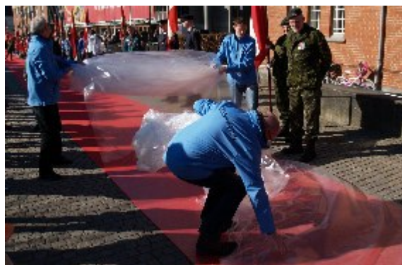
Kort før spadsereturen over Torvet blev plastikken trukket af den helt nye løber købt til lejligheden. Herning Kommune var kommet frem til, at det var billigere at eje frem for at leje til dagen.