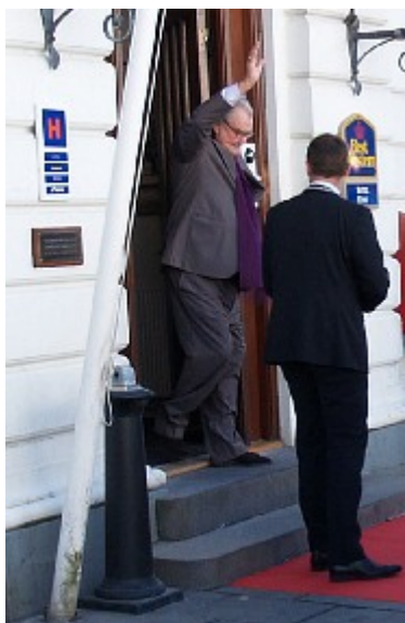
Efter frokosten forlod Prinsgemalen det fire stjernede hotel. Dagens strabadser i Herning var i solskinsvejr veloverstået.

Midt på eftermiddagen tog regentparret afsked med Herning. Satte kursen østpå til Marselisborg Slot i Aarhus.