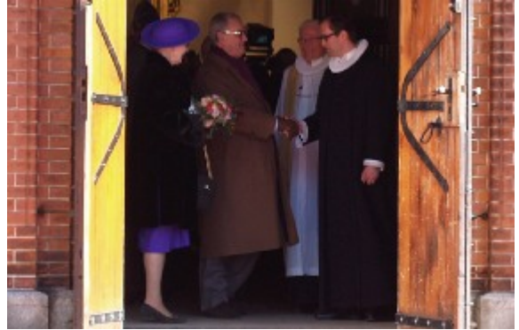
Efter gudstjenesten tog alle Herning Kirkes egne præster pænt afsked med regentparret, inden de spadserede tværs over Torvet til jubilæumsfrokost.