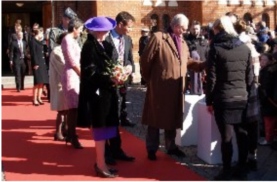
Regentparret tog sig god tid foran de studerende fra Hernings designuddannelse Via University College TEKO.