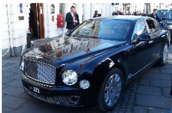
Krone 121 fra kongehusets bilpark er en Bentley Mulsanne, dronningens personvogn.