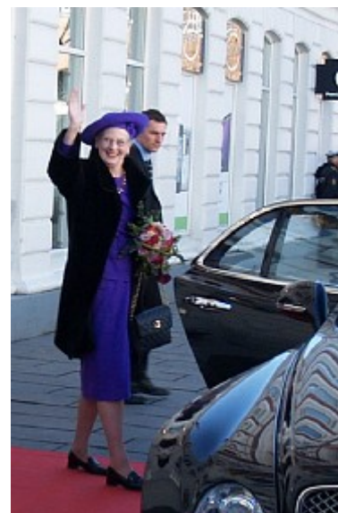
Foran Hotel Eyde tog dronningen pænt afsked med hernerne, da hun forlod Herning.