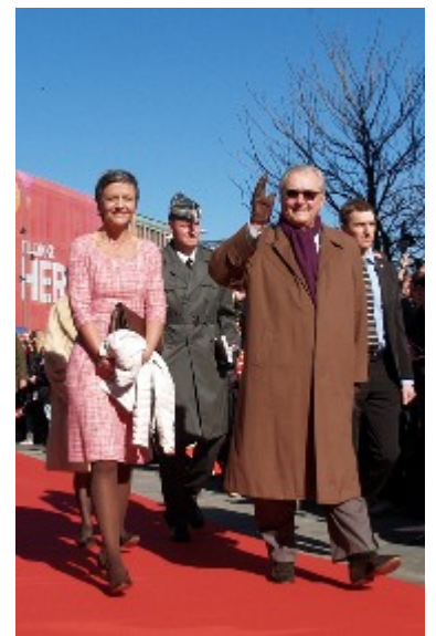
Økonomi og indenrigsminister Margrethe Vestager ledsagede prinsgemalen under spadsereturen.