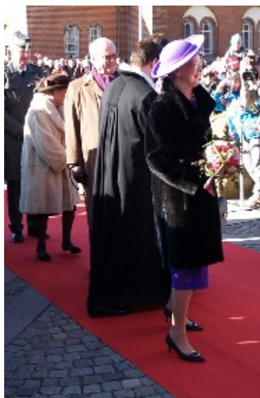
Lidt før klokken ti ankom regentparret til Herning Kirke.