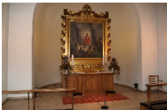
For at få kirken passet ind i bybilledet, måtte man dreje den anderledes end sædvanligt, så tårnet kom mod syd og kor og apsis kom til at vende mod nord.