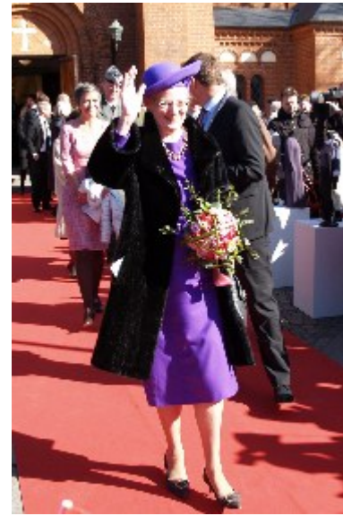
Dronning Margrethe spadserede videre op ad den røde løber med borgmesteren ved sin side.