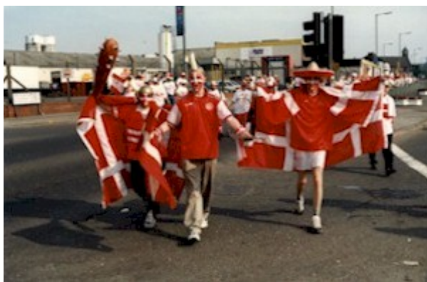
Mange tusinde roligans fra Danmark mødte op til slut-runden i England om europamesterskabet i fodbold.