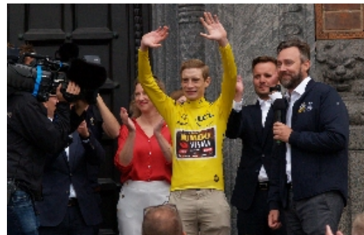
Jonas Vingegaard blev modtaget foran rådhuset i København med et kæmpe stort bravur, fra de mange tusinde, der ville være med til at modtage årets Tour de France vinder hjem fra Frankrig.