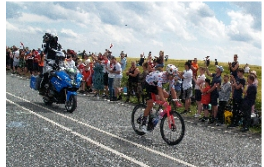
Et tv-hold fulgte straks efter Magnus Cort, da han i "ensom Majestæt" satte kursen med Sønderborg i dagens tredje og sidste etape, afviklet i Danmark i dette års Tour de France.

Efter afviklingen af de første tre etaper af Tour de France i Danmark, blev der til 6 cykelryttere uddelt bøder og pointstraf. Blandt andet danskeren Mikkel Honoré modtog en bøde for at have henkastet skrald uden for en affaldszone. Det kostede en bøde på 3700 kroner.