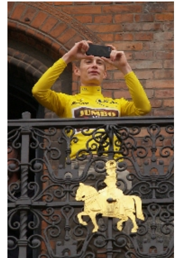
Jonas Vingegaard måtte stolt og straks forevige det fantastiske udsyn fra balkonen, da han trådte ud mod Rådhuspladsen.