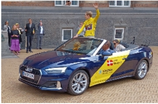
Årets Tour de France vinder, Jonas Vingegaard, blev i åbent vogn kørt fra Kastrup Lufthavn til Rådhuspladsen, hvor den officielle hjemkomst til Danmark fandt sted.