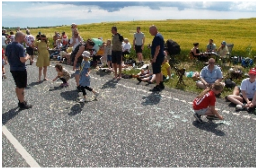
Inden 3. og sidste etape i Danmark blev sat i gang, havde børnene meget travlt med at tegne, male og skrive cykelrytternes navne på kørebanen.