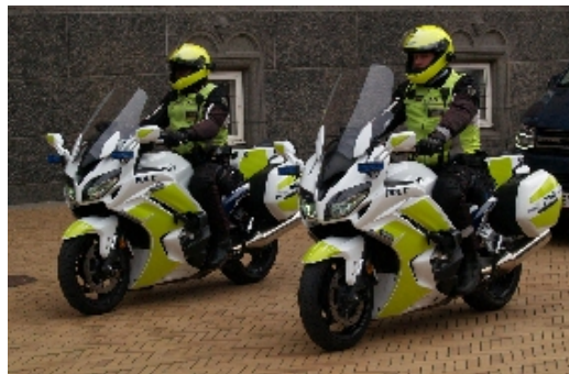
Københavns politi holdt god ro og orden overalt omkring Rådhuspladsen og Tivoli, da den store fejring af Jonas Vingegaard fandt sted.