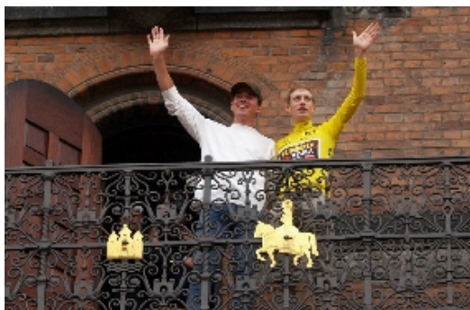
Jonas Vingegaards cykelkammerat Mads Pedersen var den første, der trådte ud på balkonen, ud mod Rådhuspladsen i København, sammen med Jonas.