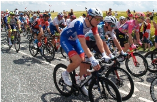
Alle de 176 ryttere med start i Vejle, der stillede op til de 182 kilometer gennemførte efter godt fire timers cykling, og kom alle i mål i Sønderborg.