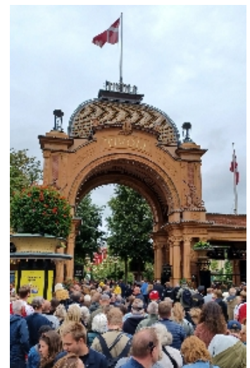
Straks efter fejringen på Rådhuspladsen valfartede alle over i Tivoli klokken 16.00, for at være med der, hvor fejringen af Jonas fortsatte.

Mon ikke Jonas Vingegaards store sportspræsentation i Frankrig i år, med sejren i Tour de France bliver kåret til årets største sportsnavn, og han tildes enkelte af årets sportspriser, der løber af stablen i årets sportskavalkader, der sendes direkte på DR1 til januar 2023.