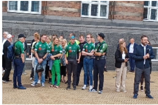
Fra Jylland mødte 17 ryttere fra cykelklubben, Thy Cykle Ring, i Thisted op på Rådhuset, for at hylde årets Tour de France vinder.