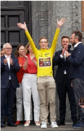
En glad og stolt cykelrytter, Jonas Vingegaard, blev med et kæmpe stort bravur modtaget foran rådhuset i København.