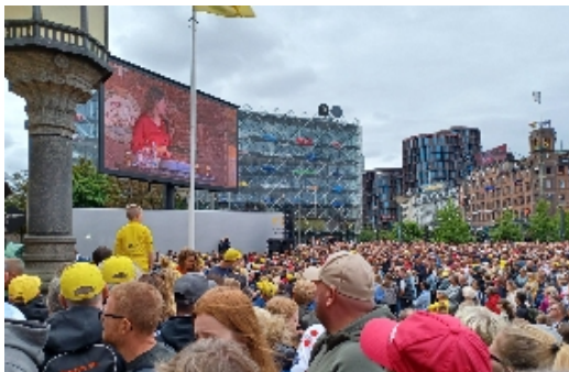
De mange tusinde fremmødte på Rådhuspladsen fulgte talerne inde fra rådhuset på storskærm, inden Jonas trådte ud på balkonen.