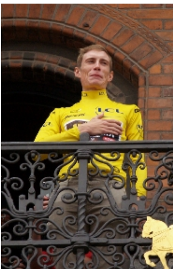
Tour de France vinderen, Jonas, nød det, da de adskillige tusinde fremmødte foran rådhuset sang den danske nationalmelodi for ham.

Skive Kommune havde planlagt et program, hvor bl.a. byens børn på cykler, iført gule trøjer og vinger, eskorterede Jonas Vingegaard-familiens Volvo gennem byen til stadion, hvor velkomsten hjem fandt sted.