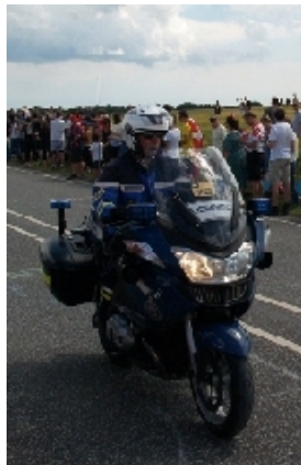
Det franske politi var også med under afviklingen af etaperne i dette års Tour de France.