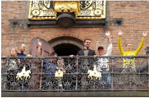
Alle de danske cykelryttere, der deltog i dette års Tour de France, viste sig stolt sammen med vinder Jonas Vingegaard på balkonen ud mod Rådhuspladsen.