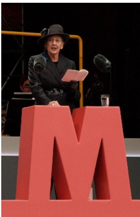
Midt på eftermiddagen, omkring klokken 14.45, gik Dronning Margrethe på taler-stolen og erklærede Cityringen M3 for åbnet.

Københavns Metro Søndag den 29. september 2019