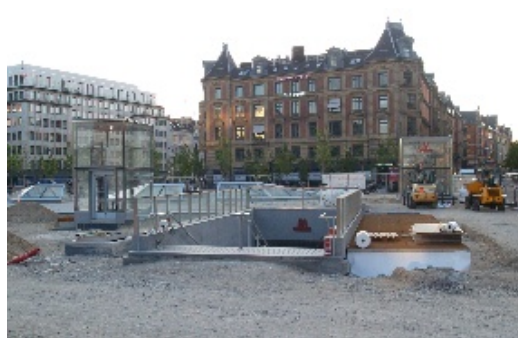
Spændingen var på et meget højt niveau den 29. september. Nedgangen til metrostationen på Rådhuspladsen var nemlig lørdag den 13. juli kun kommet til dette punkt. I dag var stationen endelig færdig og klar til indvielsen af M3 .