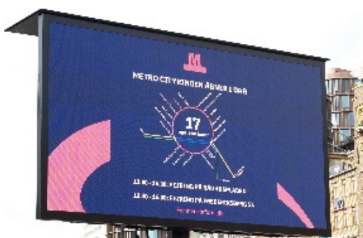
Klokken 16.00 blev alle de 17 nye metrostationer i undergrunden åbnet, hvor godt 127.000 passager benyttede sig af en gratis tur på selve åbningsdagen i metroens nye Cityring .