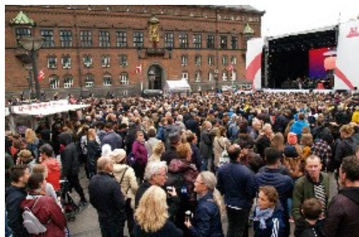
Hele Rådhuspladsen i København var under metro-indvielsen meget tætpakket med mange tusinde mennesker.

Majestæten kiggede nysgerrigt ud af frontruden og betragtede de mange flotte farver, man havde givet de 17 nye stationer. Hver station har sin egen farve.