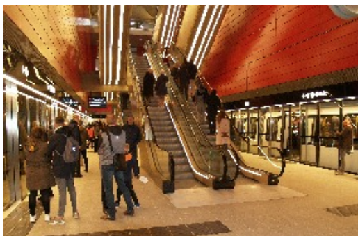
Køen ved Rådhuspladsen var flere hundrede meter lang, så jeg gik over til Københavns Hovedbanegård. Ventede til kl. 16.00 og tog med metroen her fra den flotte røde station.