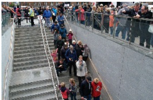
Præcis klokken 15.00 åbnede metrostationerne på Rådhuspladsen og Frederiksberg. Befolkningen havde nu fået adgang til Cityringen . De sidste 15 stationer åbnede man først klokken 16.00.

Når sidste etape af metroen, en afstikker fra Cityringen , M4 åbner, i starten af næste år, 2020, kan man køre fra Orientkaj i Nordhavnen og hele vejen ind til København H, hvor metrolinjen allerede i 2024 vil blive forlænget til Ny Ellebjerg. Til næste forår åbner man strækningen fra København H - Orientkaj, hvor M4's otte nye stationer hedder: (Seks metrostationer fra Cityringen ), København H - Rådhuspladsen - Gammel Strand - Kongens Nytorv - Marmorkirken - Østerport og mod nord, Nordhavn - Orientkaj. Yderligere åbnes fem nye stationer i 2024 mod syd for København H - Havneholmen - Enghave Brygge - Sluseholmen - Mozarts Plads og sidst Ny Ellebjerg.