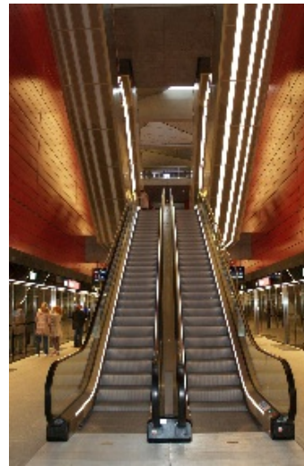
Østerport metrostation er også en af de røde stationer, fantastisk flot.