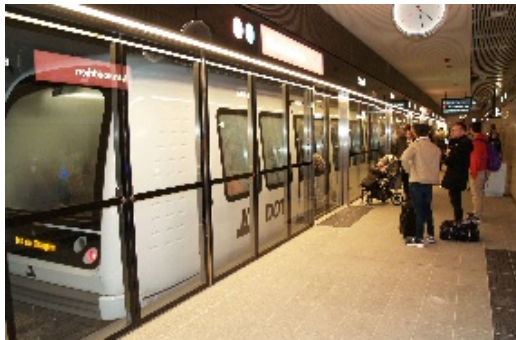
Metrostationen, spor 2, her ved Marmorkirken og Amalienborg er på to niveauer. For at komme til spor 1 må man tage trapperne eller elevatoren op.

Med M3 Cityringen i dag og de kommende to metrolinjer, M4 til Nordhavnen i 2020 og Sydhavnen i 2024, får København 24 nye metrostationer. Det vil sige, at fra 2024 vil hovedstaden have 44 metrostationer, der binder store dele af byen sammen.