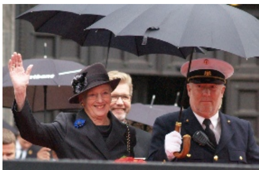
Dronningen blev i let regnvej, kl. 14.00, ledsaget under en paraply, ud fra Rådhuset til de opstillede VIP pladser med varme tæpper på Rådhuspladsen.