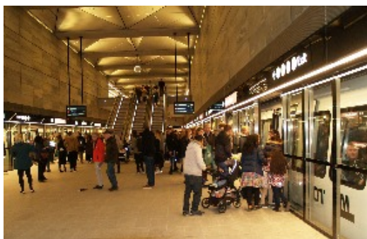
Da alle metrostationer klokken 16.00 slog dørene op, gik folk ned fra alle sider. Ned til de 17 nye stationer i Cityringen .