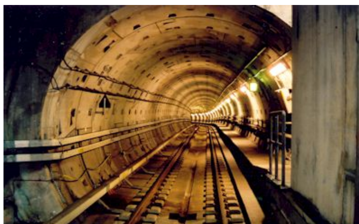
Hele Cityringen M3 er en underjordisk boret tunnel nede i omkring en tredve meters dybde. M3 er 15,5 kilometer lang og består af 17 underjordiske metrostationer. En rundtur i den nye Cityring , gennem samtlige stationer, kommer til at tage blot 24 minutter.

åbningen af M1 og M2 , ved metrostation Kongens Nytorv.