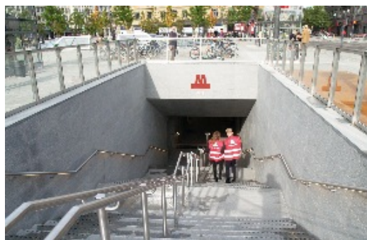
De mange tusinde fremmødte på Rådhuspladsen og Solbjerg plads ved Frederiksberg metrostation ventede kun på dagens højdepunkt, at kunne komme ned til metrotog i undergrunden.