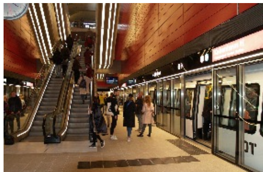
Alle 17 metrostationer i undergrunden, M3 , er præget af fantastiske farver, som stationen her i rødt, Københavns Hovedbanegård. Alle metrostationer er lyse og venlige.