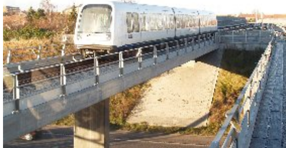
Den nye etape til lufthavnen var tænkt som en bane under jorden, men toget kører mest på terræn over jorden, ved lufthavnen på dæmning.

Mellem Lergravsparken og den nye station ved Terminal 3 i lufthavnen standses på fire nye Metrostationer, Ørestad, Amager Strand, Femøren og Kastrup. Den nye strækning er bygget over jorden og har kostet 1,7 milliarder kroner. Projektet blev færdig en måned før den oprindelige tidsplan, der betød at budgettet var overholdt.