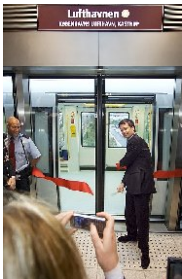
Kronprins Frederik forestod indvielsen af tredje etape til lufthavnen, fredag 28. september 2007.

Toget skal køre i otte uger, hvorefter folien fjernes igen. Efterfølgende skal forsøget evalueres grundigt. Københavns Metro kører fra klokken 5.00 om morgenen til midnat klokken 24.00. Fra torsdag morgen, til og med søndag klokken 24.00, kører Metroen hele døgnet.