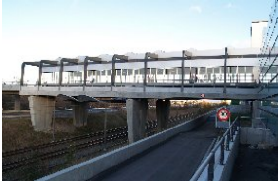
Københavns lufthavn, Kastrup har nu en Metroforbindelse til Københavns City. En rejse fra Nørreport tager 15 minutter.