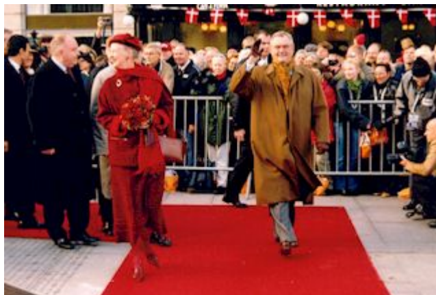
Regentparret kørte lørdag formiddag den 19. oktober 2002 første tur i Metroen fra Ørestad Metro Station med ankomst til Kongens Nytorv, hvor dronningen forestod den officielle indvielsen.

Åbningen blev markeret med kanonsalutter ved Tivoligårdens salutkanoner der var opstillet ved Kongens Nytorv Metro Station. På alle Metro stationer blev der hele dagen holdt åbningsfest med musik og underholdning.