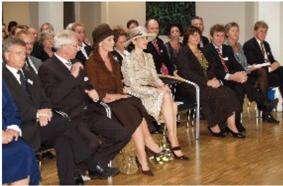
Kronprinsesse Mary tog plads på første række, hørte alle taler og blev budt officiel velkommen. Efter to timers besøg rejste Mary hjem til Fredensborg.