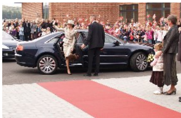
Kronprinsesse Mary ankom klokken to. Ringkøbing Garden spillede op ved modtagelsen.

Kræftens Bekæmpelse er sammen med Ringkøbing Amt ansvarlige for driften af Anker Fjord Hospice. Ophold på Anker Fjord Hospice er gratis for patienter. Hospicet modtager patienter fra hele landet.