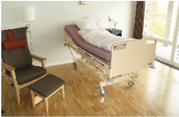
Et kik ind i lejligheden, her ses sengeafsnittet der kan skilles fra, til et rum, med en foldedør.