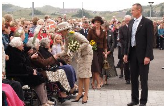
Tre til fire hundrede fremmødte, mødte op foran hospicet for at få et glimt af den kongelige gæst.