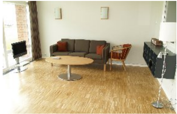
I modsatte ende findes TV stuen hvor pårørende kan opholde sig. Udsigt ud over Ringkøbing Fjord.